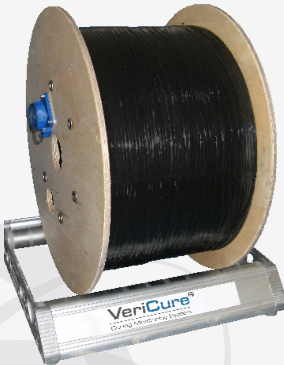
VeriCure CMS-Sensorkabel mit Kabelaufrollvorrichtung als Zubehör.

US-Patente: US 8,162,535 B2 und US 13,403,393