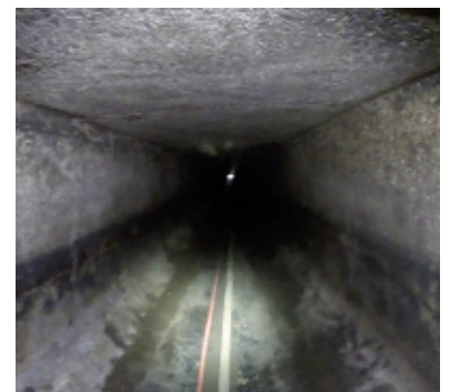
Kastendurchlass für die Auskleidung vorbereitet.