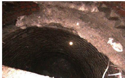
15 Betonabweiser, wie dieser gezeigte beschädigte, mussten vollständig aus dem Schacht entfernt werden.

Angesichts der Tiefe und des Zulaufs und der Einsickerung im Schacht setzte das interne QLS-Ingenieurteam hochentwickelte Konstruktions- und Finite-Elemente-Methoden ein, um den Erfolg dieses Projekts sicherzustellen.