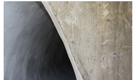
GeoKrete erstellt einen korrosionsbeständigen voll strukturellen Liner.