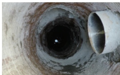
Vorher: Komplette Wiederherstellung war erforderlich, um den Abwasserkanal in den ursprünglichen Zustand zu bekommen.