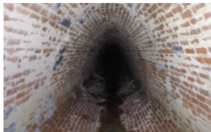
Vorher: Eiförmiger Ziegelsteinabfluss.