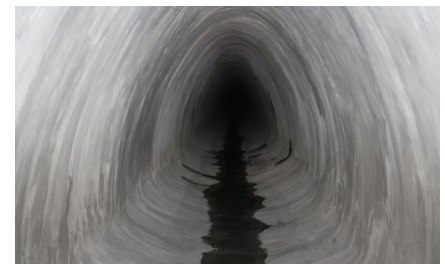
Nachher: Durchlass mit QLS GeoKrete ausgekleidet.