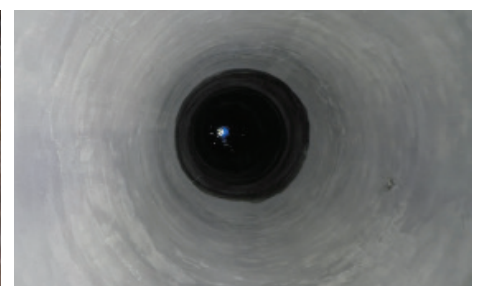
Schacht nach Auskleidung mit QLS GeoKrete.