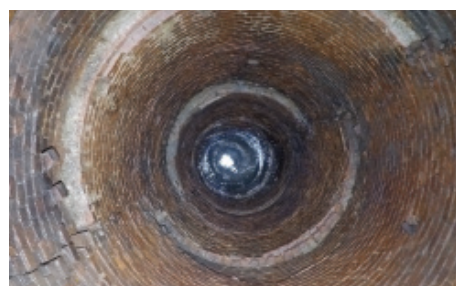
Vor der Sanierung des auffallend rissigen, 40m tiefen Schachts mussten mehrere Leitbleche entfernt werden.

Angesichts des Alters und des schlechten Zustands des Schachts wurde das Quadex Lining System® mit GeoKrete Geopolymer aufgrund seiner hervorragenden Leistungs-, Handhabungs- und Anwendungseigenschaften ausgewählt. Mit dem Quadex Lining System® (QLS) und dem hochentwickelten GeoKrete Geopolymer-Mörtelauftragsverfahren konnten mehrere kritische und schwierige Probleme gelöst werden: Extreme Schachttiefe, die allmähliche Zunahme von Zufluss und Einsickerung sowie die Möglichkeit, die Anwendung ohne nachteilige Auswirkungen zu starten und zu stoppen.